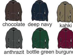
chocolate deep navy kahki